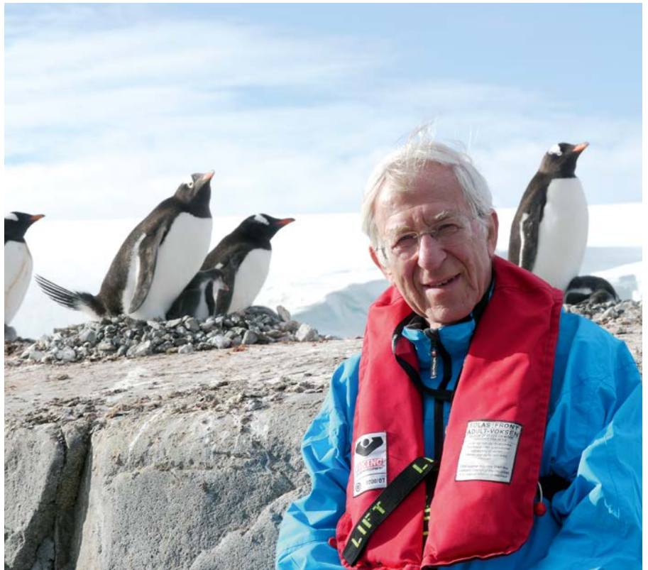
Bekannt für flammend heiße Reden für die Energiewende und eiskalte Antarktis-Recherchen: Der Journalist Dr. Franz Alt freut sich über die Auszeichnung als GREEN BRAND Germany Persönlichkeit.

Vereins und würdigte dabei die Leistungen aller ausgezeichneten Marken. „Mit GREEN BRANDS wurde ein wichtiges und einzigartiges Zertifikat geschaffen, das Unternehmen ermöglicht, ihre ‚grünen Marken‘ öffentlich zu präsentieren, dadurch ihre Absätze zu steigern und gleichzeitig einen wertvollen Beitrag zum Wandel hin zu einer nachhaltigen Gesellschaft zu leisten. Darum unterstützt der Bundesdeutsche Arbeitskreis für Umweltbewusstes Management dieses Engagement und die Publikation nach besten Kräften“.